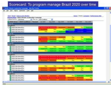
21 Gaissoft Company Presentation | © Gaissoft 2008

Zie het raamwerk en performance web van het meshwork ontstaan terwijl het zich ontvouwt vanuit de collectieve intelligentie van de deelnemers in de zaal en het zich daarna verder ontwikkeld door online samenwerking.