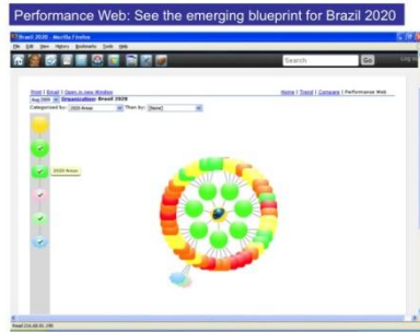
20 Gaissoft Company Presentation | © Gaissoft 2008

Zie het raamwerk en performance web van het meshwork ontstaan terwijl het zich ontvouwt vanuit de collectieve intelligentie van de deelnemers in de zaal en het zich daarna verder ontwikkeld door online samenwerking.